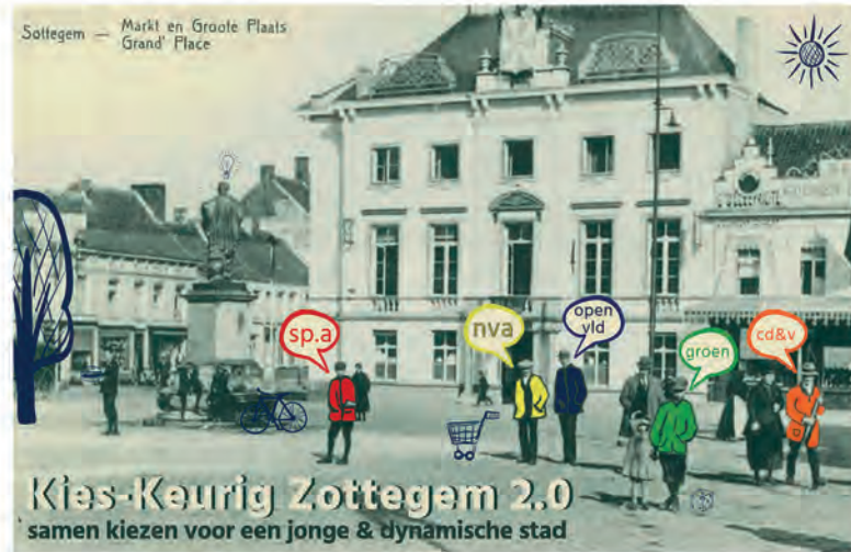
Foto: logo van het project kieskeurig-Zottegem

Op vrijdag 05 oktober kunnen jongeren en alle Zottegemse burgers hun vragen afvuren op de toekomstige beleidsmakers van onze stad tijdens het debat. De jeugdoraad legt de politici het vuur aan de schenen met heel wat brandend actuele stellingen en gevatte vragen. Naast jeugdbeleid zijn er ook heel wat andere thema's die aan de politici worden voorgelegd. Het debat vindt plaats in CC Zoetegem, Hospitaalstraat18, om 20 uur.